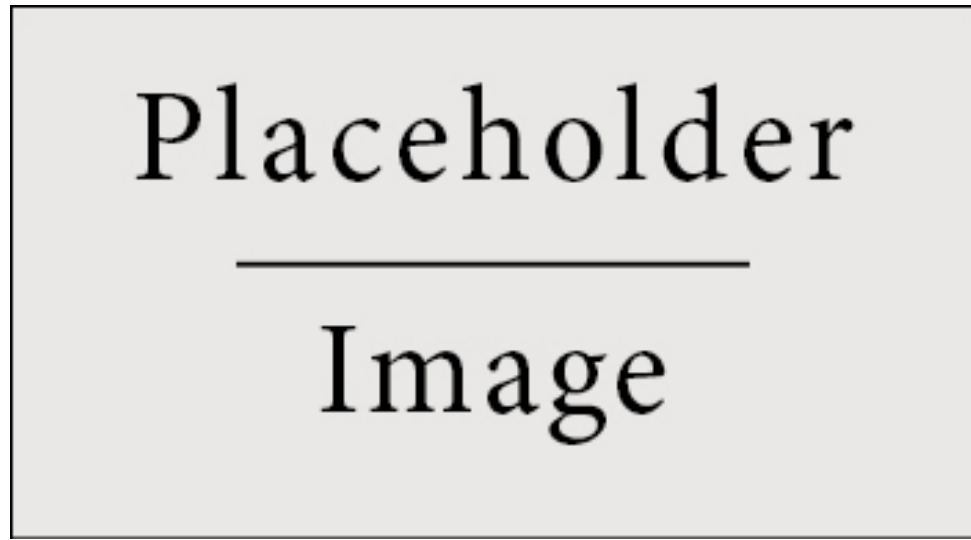
Figure 1: Figure caption